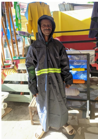
Georges med nye regnkledde

«Måltidet elevane får på skulen er veldig viktig - for ein del kan det vere einaste måltid om dagen»