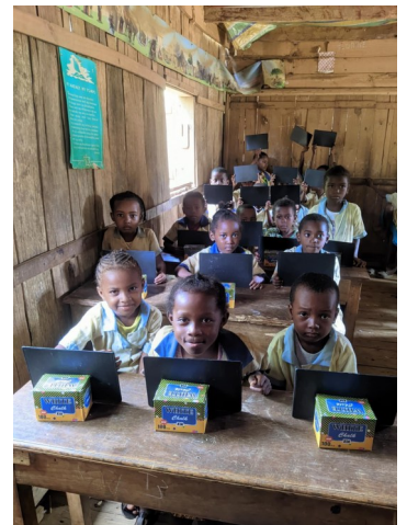
1.klasse klar for skuledag med nye tavler og kritt